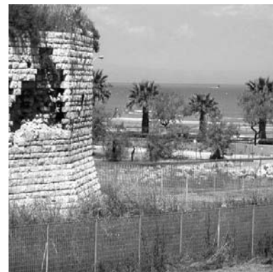
Il Paraticchio com'è

* coordinatore del Partito liberale italiano - Barletta