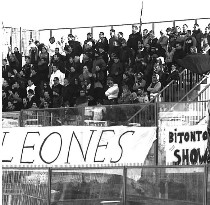
I tifosi del Bitonto a Barletta per la partita di campionato

Sotto certi aspetti la decisione è pur se per motivi di ordine pubblico - appare incomprensibile. Se da un lato si avvantaggia il pubblico barlettano che potrà maggiormente incitare la propria squadra nel delicato match per il prosieguo dell'avventura nella seconda fase del campionato, dall'altro lato mortifica e penalizza l'immagine della città, quindi l'ospitalità del pubblico biancorosso. Difatti, il provvedimento dell'Osservatorio si baserebbe su elementi che denotano problemi di sicurezza e rischio incidenti fra tifosi biancorossi e neroverdi. Rischio che in realtà